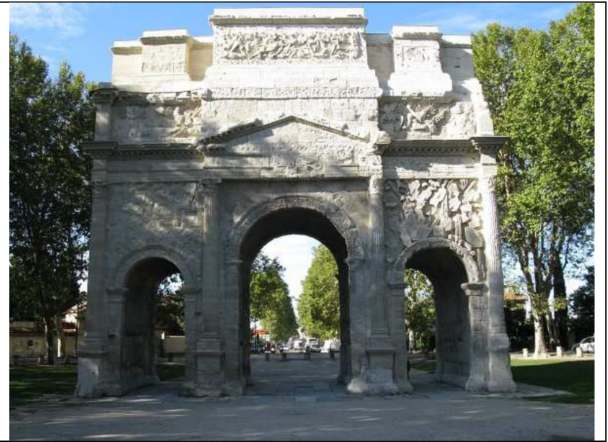
Présentation de l'arc de Triomphe