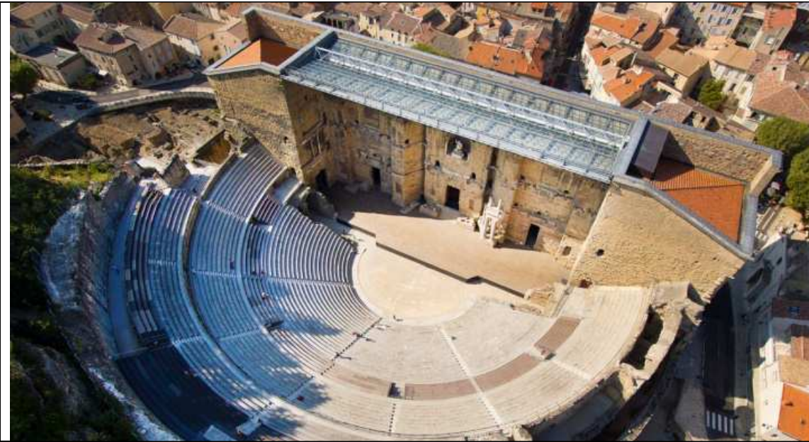
Visite audio-guidée du théâtre antique d'Orange