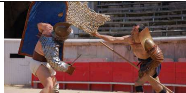
Les ateliers ACTA