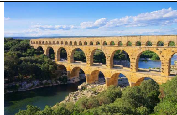
le Pont du Gard